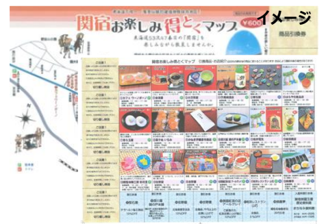
関宿お楽しみ得とくマップ

各地ー★名阪関ドライブイン着 インフォメーションにて受付【昼食と関宿お楽しみ得とくマップをゲット】ー ー<東名阪自動車道・新名神高速道路>ー菰野インター ー★御在所ロープウェイ（ロープウェイ乗り場山麓駅窓口でチケットと交換）ー各地