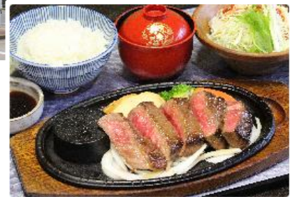
松阪牛ステーキ膳 イメージ