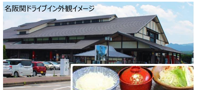
名阪関ドライブイン外観イメージ