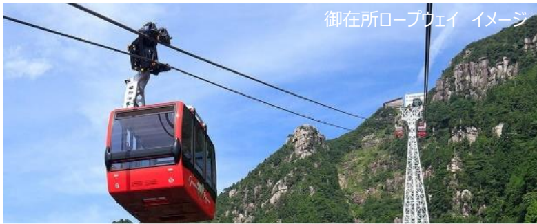
御在所ロープウェイ イメージ

名阪関ドライブインの松阪牛ステーキ膳（通常価格3,850円）と関宿お楽しみ得とくマップ（通常価格600円）、御在所ロープウェイ往復乗車券（通常価格大人2,450円、こども1,220円）がセット（通常価格大人6,900円）