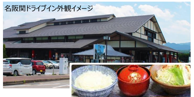
名阪関ドライブイン外観イメージ